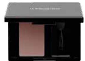
Magic Shadow 51 Pale Mauve

La coupe parfaitement adaptée à la texture bouclée est une habile combinaison de dégradés effilés, qui fait ressortir le mouvement des boucles et lui apporte un volume naturel. Magic Shadow 51 Pale Mauve dessine le regard et souligne la présence souveraine et distante du look.