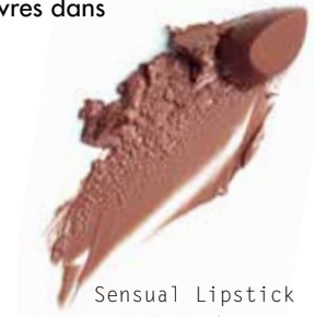
Sensual Lipstick G333 Cashmere